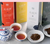
試飲・休憩コーナー