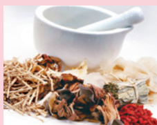
漢方・生薬コーナー